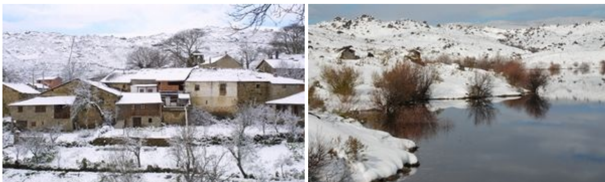
Aldeia de Montesinho e barragem da serra Serrada.

Parque Natural de Montesinho (PNM). PR 3 - Porto Furado. Percurso pedestre com cerca de 8 km. Breve descrição. Mapa. Folheto.